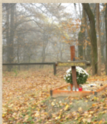
és az ismeretlen kator