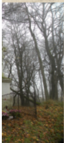
találtuk ezt a keresztet,