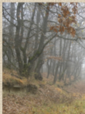
A köd még mindig