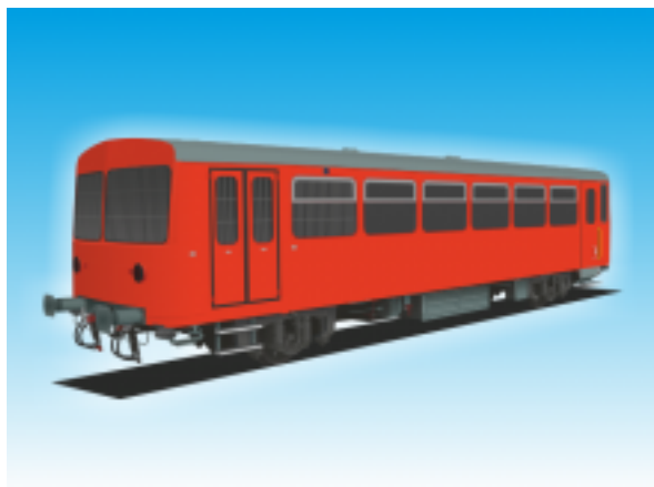
[27] Regionális kerékpárszállító kocsi (poggyásztéres