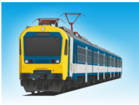
[4] Villamos motorvonat IV. (Hernyó)

6 db kerékpár szállítható a vezérlőkocsi kerékpárszállító terében kampókra akasztva.