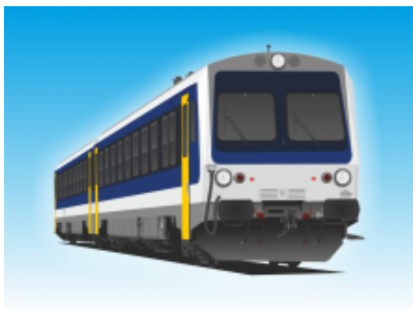
[8] Dízel motorvonat III. (Jenbacher)

5 db kerékpár szállítható a kerékpárszállító szakaszban kampókra akasztva.