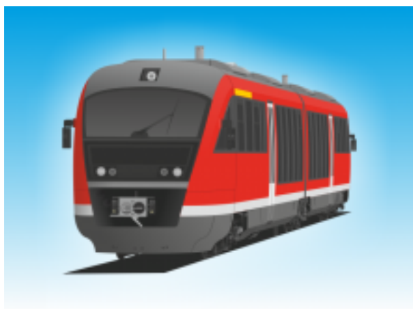
[6] Dízel motorvonat I. (Desiro)

4 db kerékpár szállítható a többcélú térben, a lehajtható üléseknél.