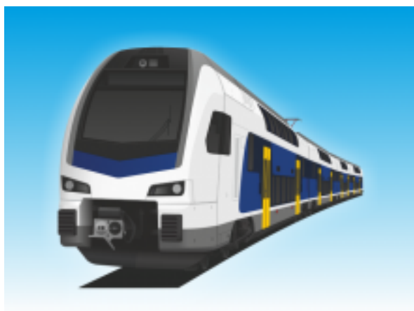
[2] Villamos motorvonat II. (KISS)

12-36 db kerékpár szállítható az utastér kijelölt részén (a vonat közepén) övvel rögzítve. A nagy kapacitású járművek a Velencei-tóhoz közlekedő G43-as és a Dunakanyarba induló Z70-es járatokon fognak közlekedni 2024 nyarától, folyamatosan növekvő számban. Alacsonypadlós, légkondicionált jármű.