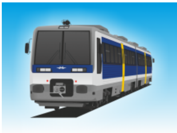
[7] Dízel motorvonat II. (Uzsgyi)

2 db kerékpár szállítható a többcélú térben kampókra akasztva.