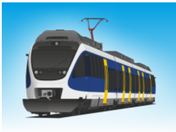
[3] Villamos motorvonat III. (Talent)

6 db kerékpár szállítható az utastér kijelölt részén (a lehajtható üléseknél) műanyag szíjakkal rögzítve.