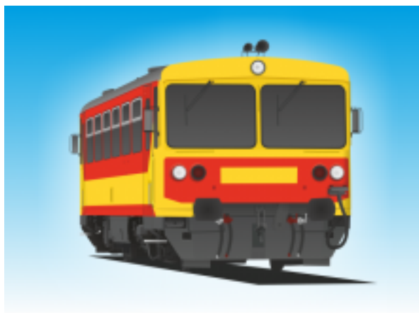
[9] Dízel motorvonat IV. (Bzmot)

2 db kerékpár szállítható kocsinként a többcélú térben (egyes járművek esetében kampókra akasztva).