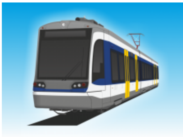
[5] Dízel-villamos motorvonat (TramTrain)

4 db kerékpár szállítható a többcélú térben biztonsági övvel rögzítve (az aktuális zsúfoltság függvényében) .