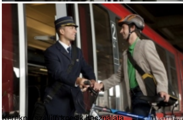
Kerékpárszállító kosarak használata