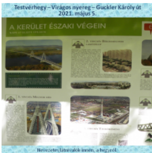
Nevezetes látványok innen, a hegyről.