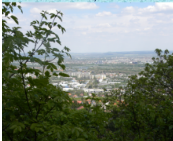
Mindent egybevetve nagyszerű kis túra volt az elejétől a végéig.