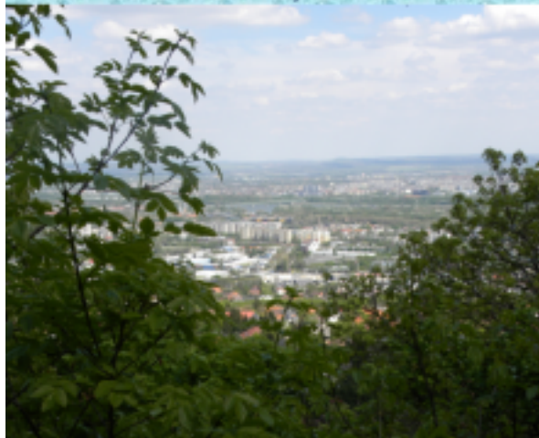
Mindent egybevetve nagyszerű kis túra volt az elejétől a végéig.