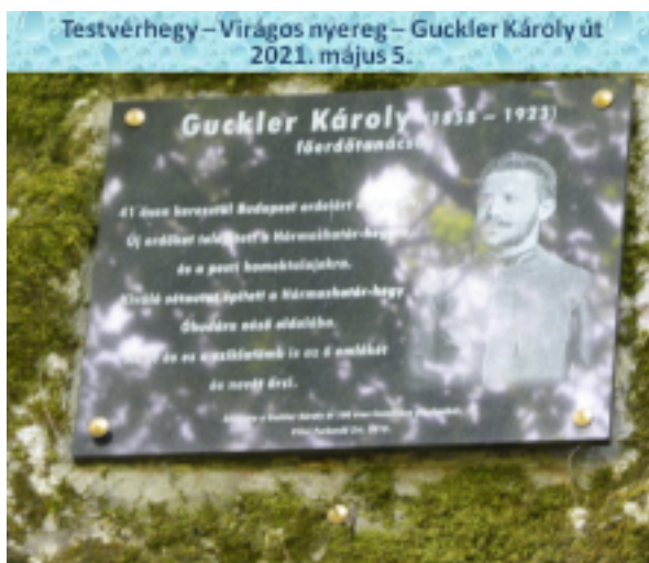
A sétányt 1924-ben, 1 évvel a halála után nevezték el a főerdészről.