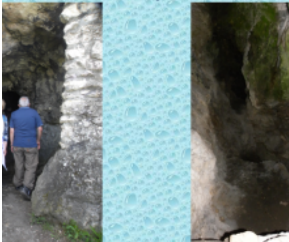
A barlang bejárata és belseje.