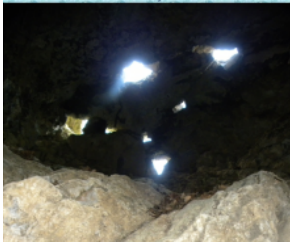
A barlang mennyezetete beszakadozott.