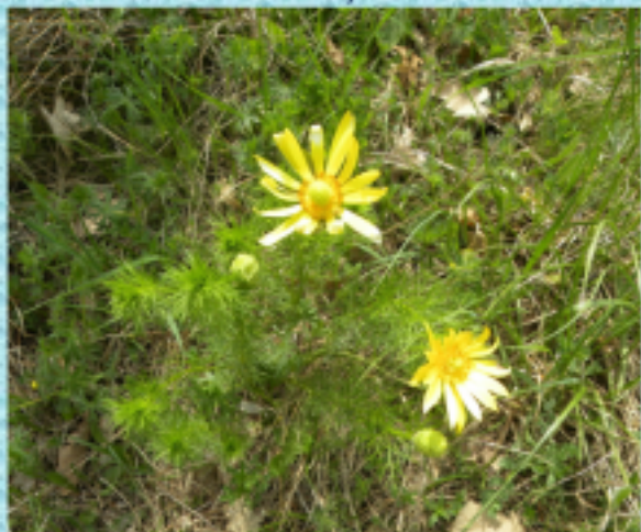
Már nyílik a Tavaszihérics.