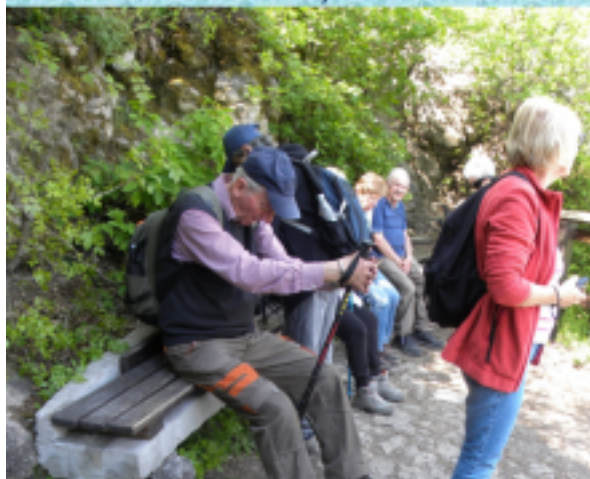
Pihenő a túra vége felé.