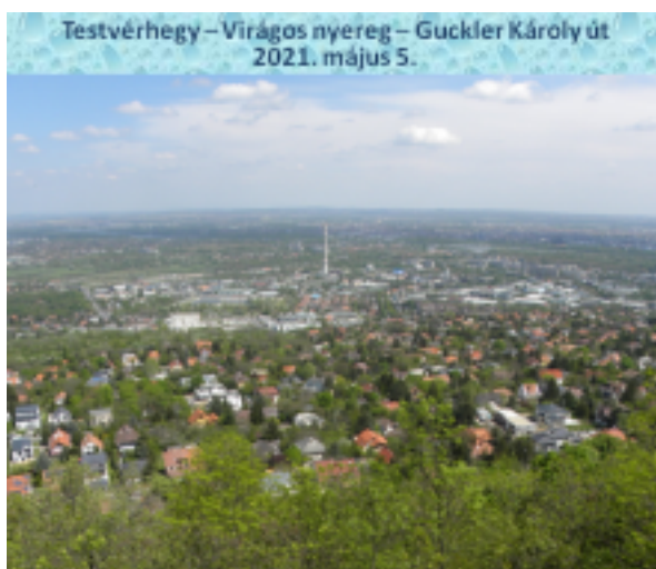
A sétányon kilátópontokat is létrehozott.