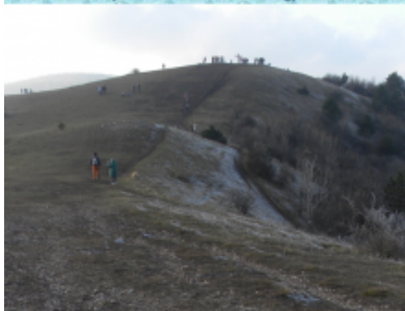
A Budai hegység egyik legszebb kilátást nyújtó hegye, a kopár és kerek kúpokból álló Nagy Szénás (550 m).