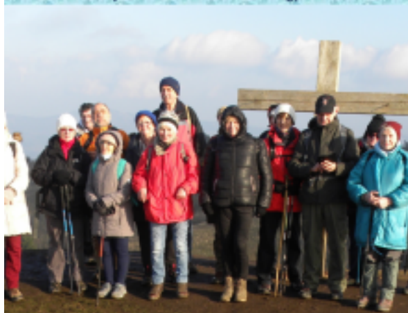
Túránk csúcspontján, a Nagy Szénáson (550 m).