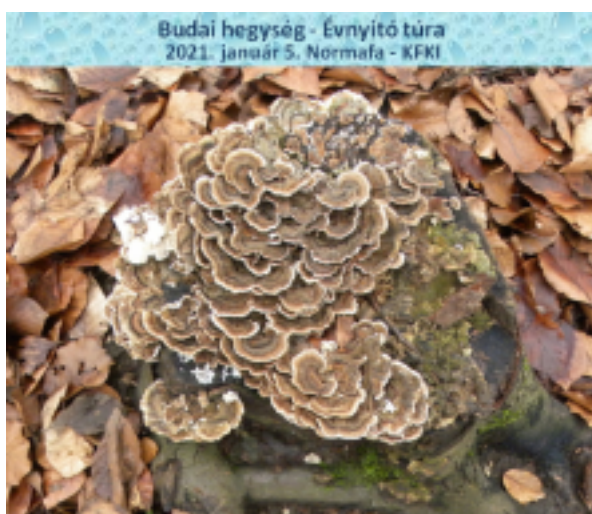
Budai hegység - Évnyitó túra 2021. január 5. Normafa - KFKI

elyet elhagyva, tovább lépkedve az erdőben, felfedeztünk egy lepkeapl amely nagy telepekben tenyésző, gyakori gombafaj