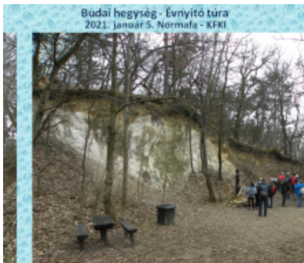
Budai hegység - Évnyitó túra 2021. január 5. Normafa - KFKI