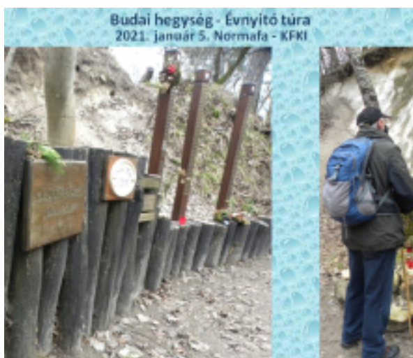
Budai hegység - Évnyitó túra 2021. január 5. Normafa - KFKI

Idé ezente szerveznek kegyeleti emlé a halottak napját követő első szombaton hogy méltóképpen emlékezzenek elhunyt t