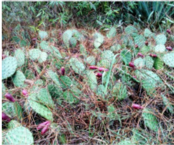
Észak-Amerika fenyői alatt él a télálló coloradói fügekaktus. MAV Zrt. partnerünk és fő támogatónk.

Soroksári Botanikus Kert; 2020. október 16.