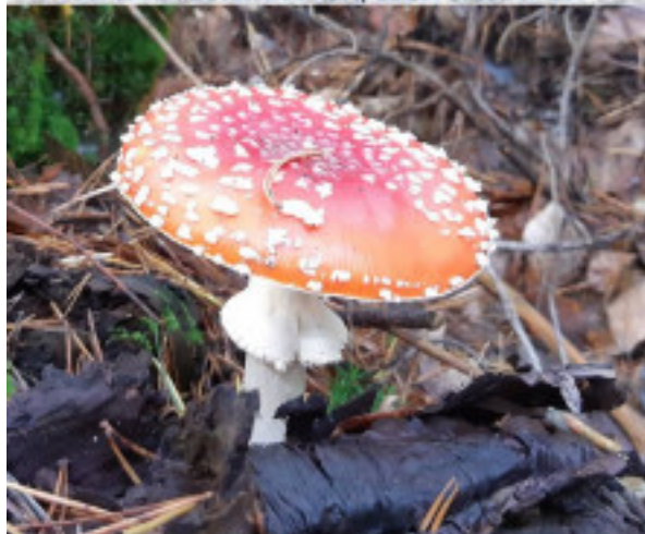
Légyölő galóca, a „mesegomba”! Vigyázat! Halálos!!! MAV Zrt. partnerünk és fő támogatónk.

Soroksári Botanikus Kert; 2020. október 16.