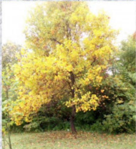
Észak-Ázsia fája lombhullás előtti őszi színekben pompázik. MAV Zrt. partnerünk és fő támogatónk.

Soroksári Botanikus Kert; 2020. október 16.