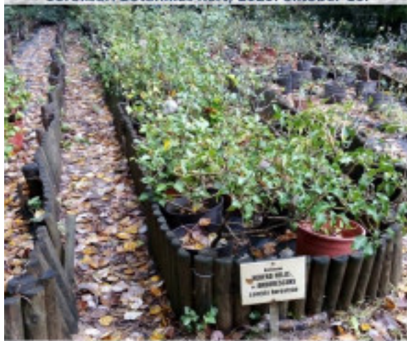
ágyásokban borostyánfélék, közepén a cserjes borostyán MÁV Zrt. partnerünk és fő támogatónk.

Soroksári Botanikus Kert; 2020. október 16.