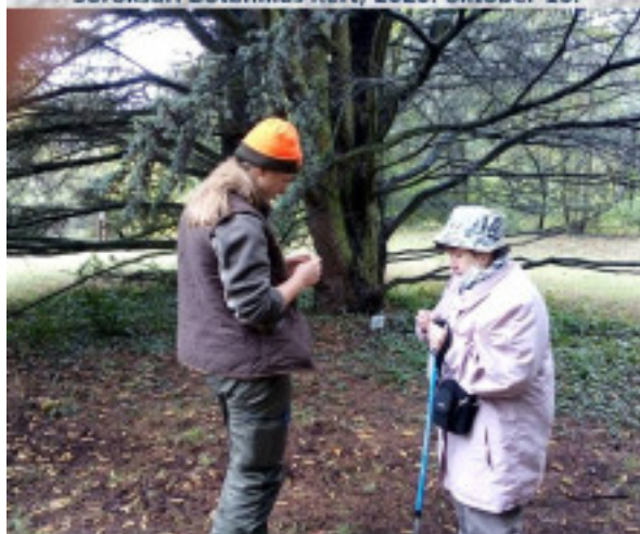
atlász-cédrus előtt annak termését vizsgálja Júli és Ilonk MÁV Zrt. partnerünk és fő támogatónk.

Soroksári Botanikus Kert; 2020. október 16.