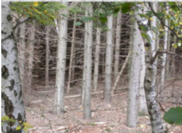
Telepített lucfenyők az erdőben. MÁV Zrt. partnerünk és fő támogatónk.

Mátraháza-Galyatető-Mátrászentistván 2020. október 10.