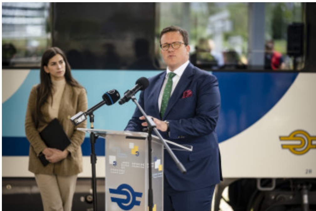
[2]Idén május 15-től június

A 2021-es előszezonban mintegy 200 ezren szálltak vonatra, hogy ellátogassanak hazánk legnagyobb tavához. Tavaly ugyanebben az időszakban két és félszeresére, félmillióra emelkedett a balatoni előszezon utazásszám, köszönhetően a járványhelyzeti korlátozások fokozatos feloldásának és a vasúti fejlesztéseknek. 2022 május közepétől szeptember közepéig az elő-, fő- és utószezon idején pedig kiemelkedő, összességében közel 3 millió utazást regisztrált a vasútvállalat, ezzel a 2021-es, szintén a teljes szezonra vetített évtizedes, 2 milliós csúcsát nagyságrendekkel meghaladta.