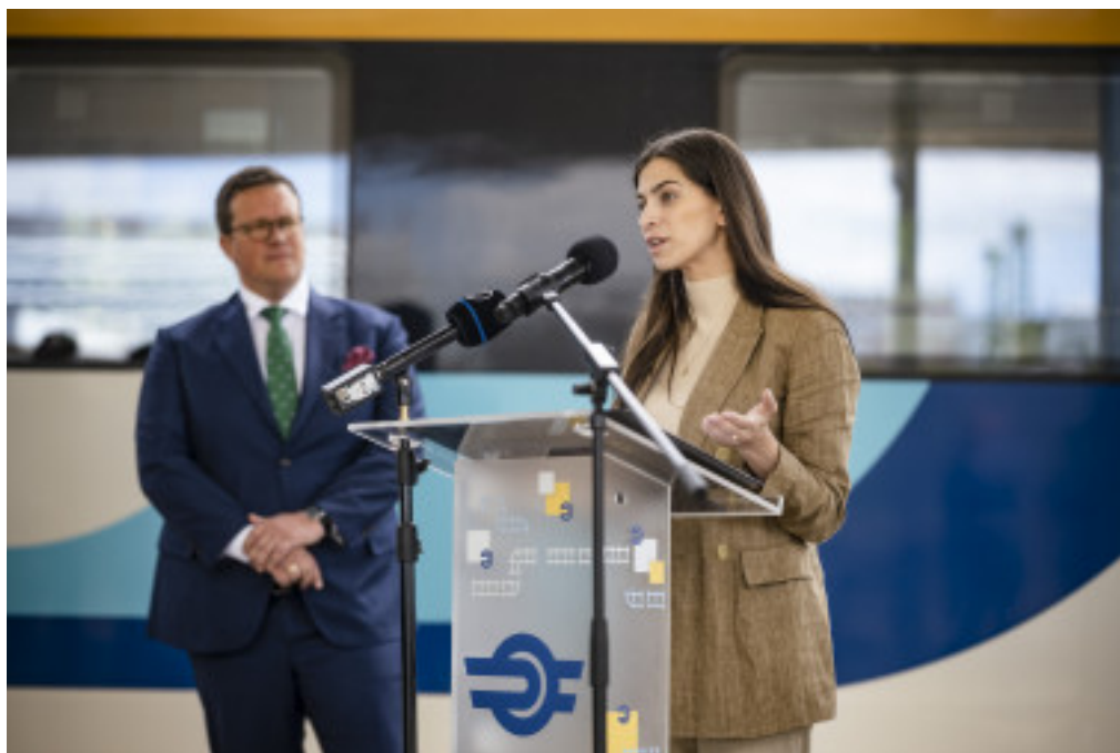
[1]A részletes, térképekkel

illusztrált tájékoztatóhoz ide kattintva ugorhat .